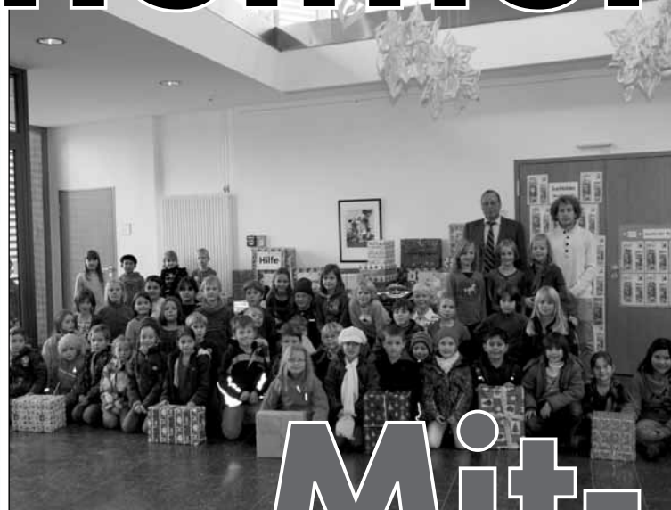
Kinder helfen Kindern – Rumänienhilfe an der Grundschule Kleinostheim